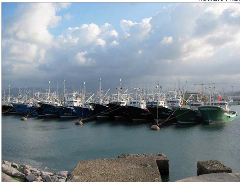
Flota de caña y línea en el puerto vasco de Hondarribia. Las flotas industriales se organizan en asociaciones de armadores

Un primer indicador de esta pérdida del poder negociador de las Cofradías lo constituye el creciente protagonismo de otras organizaciones del sector como las asociaciones de armadores, las organizaciones de productores y las asociaciones de comerciantes de pescado. Estas entidades están empezando a ocupar una parte importante del espacio político y de negociación que hasta ahora era propio