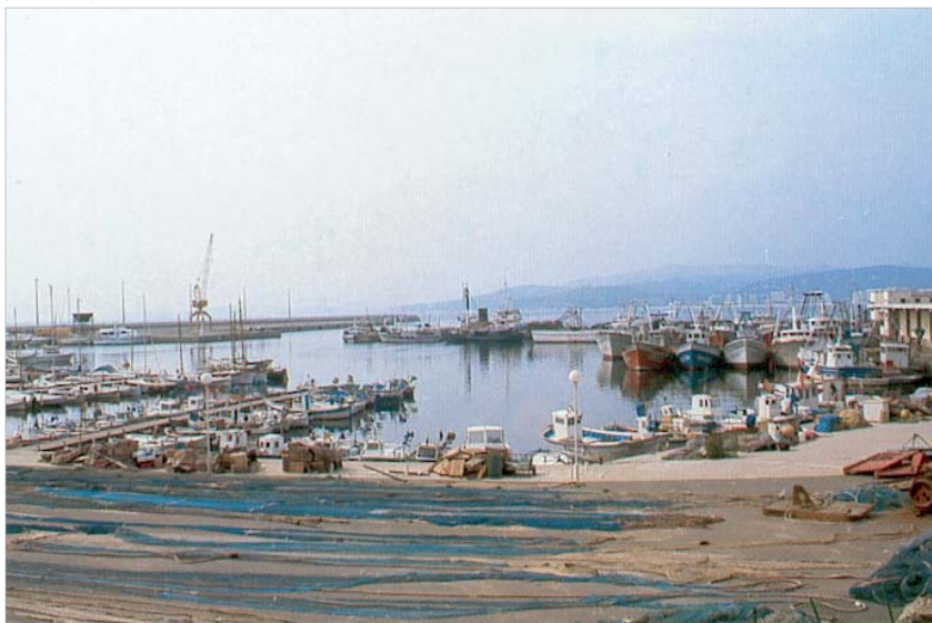
Puerto de Palamós. Se adjudica a cada Cofradía un espacio de la línea de costa desde donde tienen jurisdicción para organizar la actividad pesquera