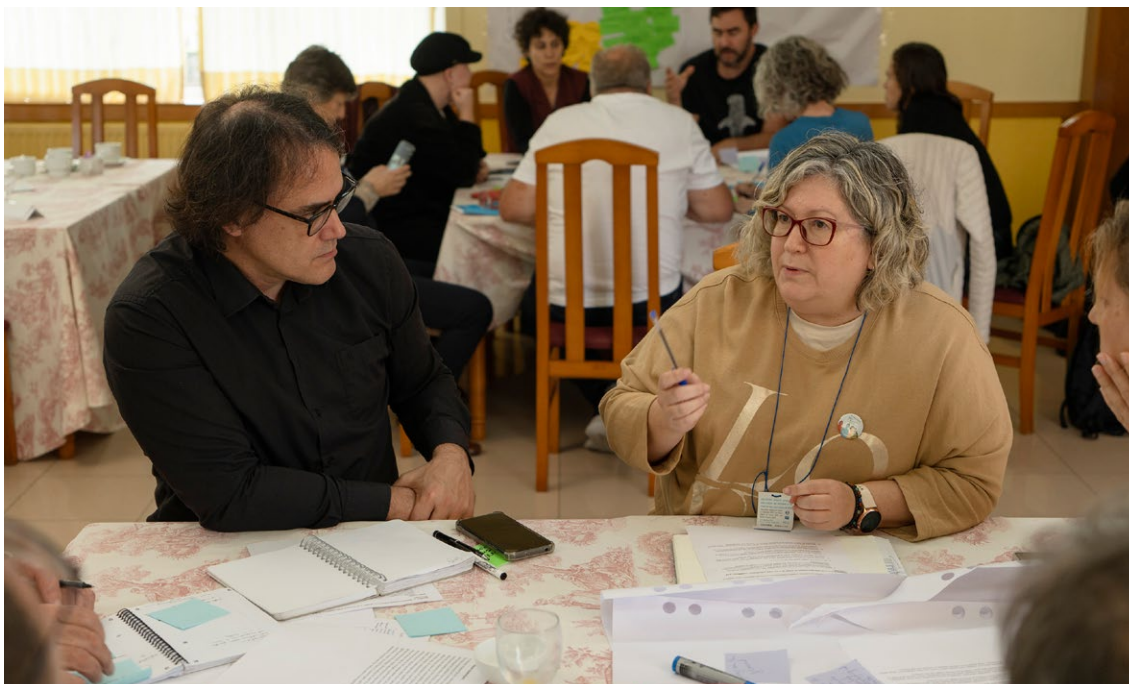
Los participantes debaten los principales retos, oportunidades y estrategias para la cogestión en el contexto de la PPE

empezando por explicar la idea a los propios pescadores. Además, conviene cierta regulación. Si se deja la autorregulación a los pescadores, podrían surgir conflictos entre ellos.