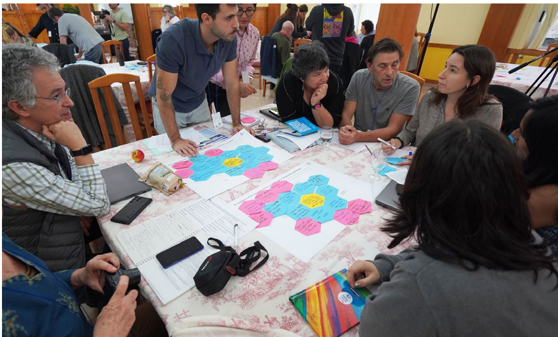
Trabajo en grupo de la sesión 1: “Creación conjunta de narrativas positivas de la PPE en Europa”

Una vez finalizadas las sesiones de debate en todos los grupos, se presentaron los resultados en sesión plenaria.