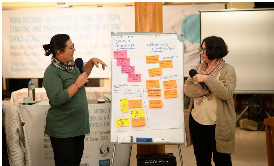
Presentación del trabajo en grupo tras los debates en la sesión 3

o cogestión. También apuntaron a LIFE y CIAPA como entidades que pueden llevar cuestiones a Bruselas y representar a todos, ya que tienen esa capacidad de intervenir y recabar fondos en ese nivel. Mencionan asimismo a AKTEA, para aportar dimensión de género e inclusividad.