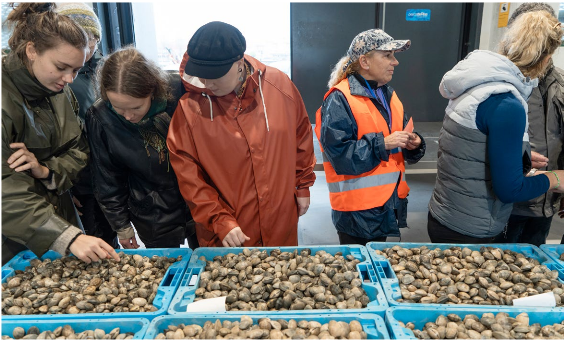
Asistentes al taller en visita al terreno de la Lonja de Vilanova de Arousa

El grupo visitó la playa de Castelete para ver a las mariscadoras en acción y debatir sus procesos de cogestión. Posteriormente, los delegados y delegadas visitaron la Lonja de Vilanova de Arousa para comprender los procesos de clasificación y valoración del producto.