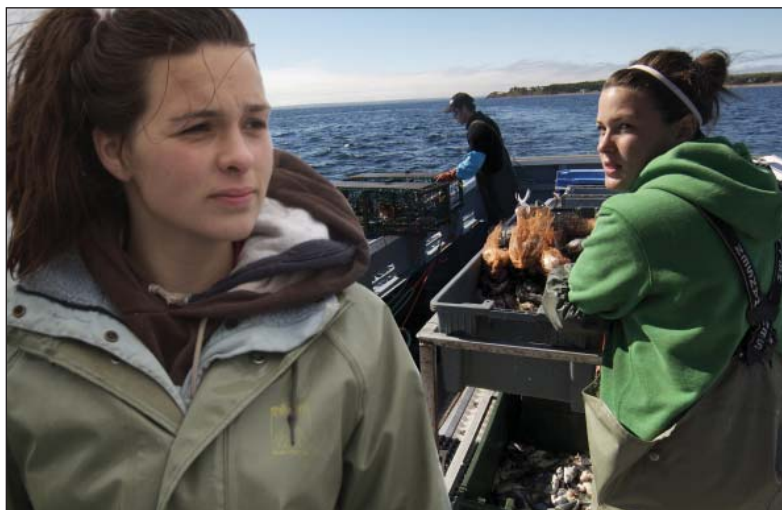
Fallon y Grace no tienen inconveniente en ser las únicas mujeres a bordo. Los tiempos están cambiando, y mucho