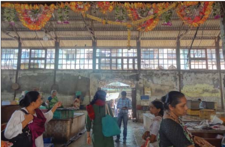
En el mercado de Byculla Gujari los propietarios han cortado los servicios básicos. No hay seguridad para las vendedoras ni para el pescado