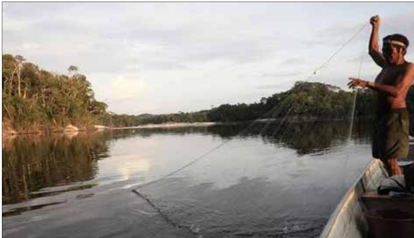
Pêcheur indigène sur le Rio Negro, tributaire de l'Amazone. Nos principales activités visant à renforcer la durabilité sociale et environnementale dans la région portent sur des projets associés au tourisme.

environnemental) a préparé en différentes langues indigènes des brochures à distribuer le long du Rio Negro, avec des directives pour prévenir la contagion et reconnaître les symptômes. Ici nous avons diffusé cette documentation dans la communauté de Roçado, en portugais, nheengatu et nadeb ».