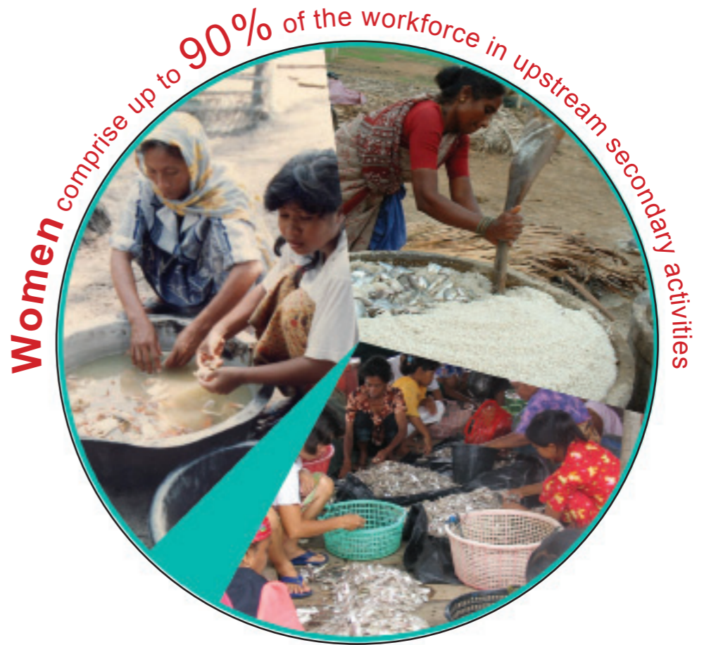
Women comprise up to 90% of the workforce in upstream secondary activities

ကမ္ဘာပေါ်ရှိ သန်းပေါင်းများစွာသော လူအများအတွက် အသေးစားငါးလုပ်ငန်းသည် လူမှုရေးနှင့် ယဉ်ကျေးမှုဓလေ့အရပါ ၎င်းတို့ နေထိုင်ရှင်သန်ရပ်တည်မှုအတွက် ဖြည့်တင်းပေးလျက်ရှိပါသည်။