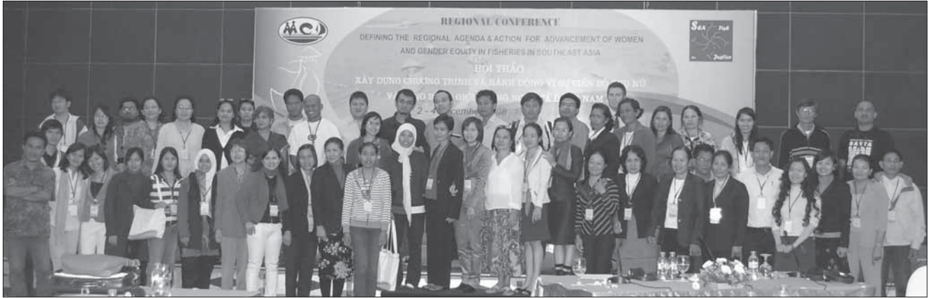
Participantes en la conferencia “La mujer en la pesca en el sudeste asiático”

del camarón y recomienda prácticas acuícolas con responsabilidad social y ambiental que redunden en beneficio de las comunidades y fomenten la justicia social. Aboga asimismo por una agenda regional sobre igualdad de género y sobre la mujer en la pesca, haciendo especial hincapié en los derechos de la mujer y apoyándose en experiencias locales y nacionales.