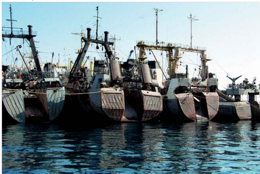
Pesqueros amarrados en el puerto de Las Palmas, islas Canarias, España. Los Estados de abanderamiento estarán obligados a emitir certificados que garanticen la legalidad de los productos pesqueros importados por la UE