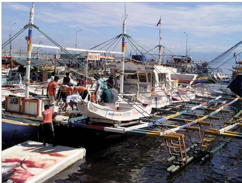
Pamariles , pesqueros filipinos con casco de madera para la pesca del rabil. La UE quiere hacer obligatorios los certificados que establezcan la legalidad de los productos pesqueros importados.

Las repercusiones de las medidas propuestas son considerables, teniendo en cuenta que prácticamente todos los países productores del mundo exportan a la UE. Los Estados que ya cuentan con regímenes de conservación y gestión y con disposiciones similares a las previstas por la UE saldrán ganando, mientras que los que carecen de ellos sufrirán las consecuencias. La exigencia de observar normas de conservación y gestión para acceder al mercado de la UE y de ejercer todos los controles que son responsabilidad de un Estado de pabellón supondría una reducción de la competencia que plantean las exportaciones a bajo precio hacia la UE, especialmente procedentes de los países en desarrollo y permitiría a los pescadores