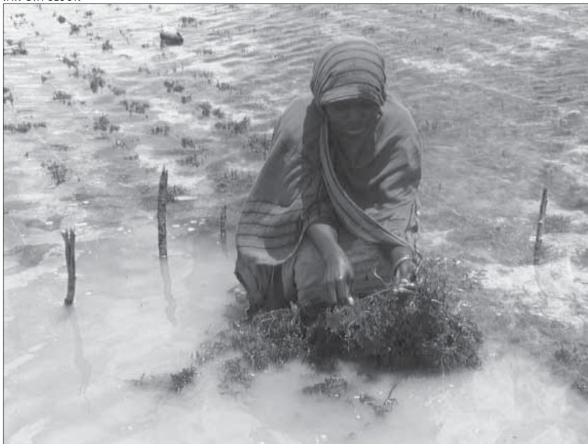
Una mujer recoge algas en el Parque Marino Nacional de la isla de Mafia, en Tanzania. En todo el mundo se fomenta la creación de parques marinos para proteger la biodiversidad

asimismo la necesidad de establecer objetivos e indicadores claros y de una sabia mezcla de procesos de planificación participativos y adaptativos.