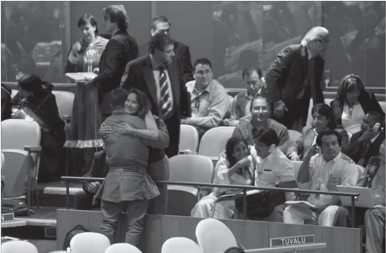
Los pueblos indígenas congregados en la sala de la Asamblea General de la ONU celebran la adopción de la Declaración de las Naciones Unidas sobre los derechos de los pueblos indígenas en septiembre de 2007

abrir un espacio a los interesados en el tema y presionar a los Gobiernos para que tomen la iniciativa.