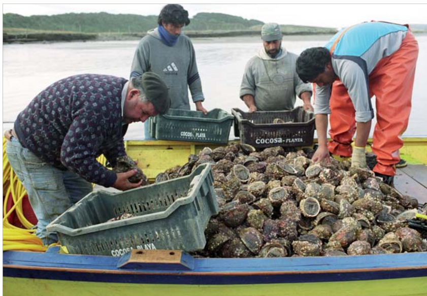
Débarquement de locos. Les pêcheurs peuvent emprunter auprès des banques qui se garantissent sur les stocks détenus par les AMERB