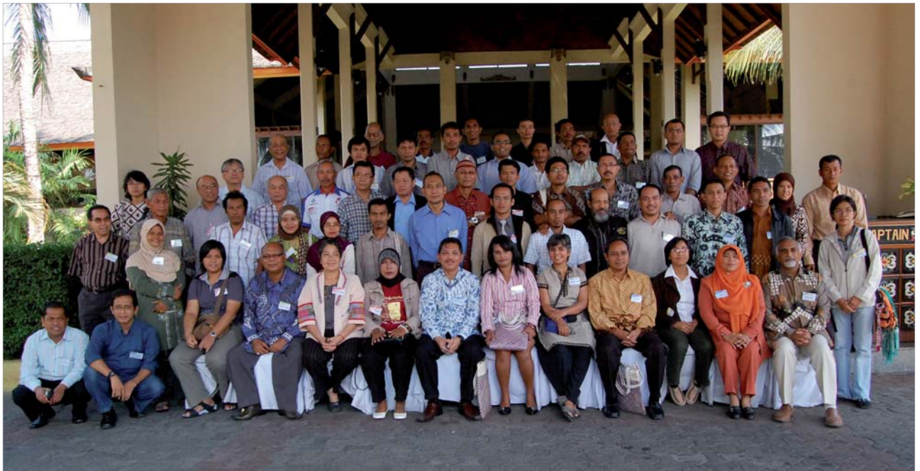
Soixante délégués venus d'Indonésie, des Philippines, de Thaïlande, de Malaisie et de l'Inde se sont réunis à Lombok, Indonésie, pour participer à l'atelier sur les institutions coutumières de la pêche