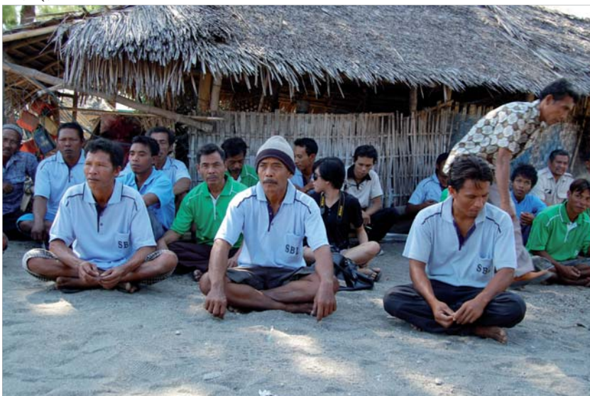
Visite sur le terrain au village de Jambianom, Lombok. Les autorités locales et des habitants ont parlé de ce qui était fait pour protéger les récifs coralliens