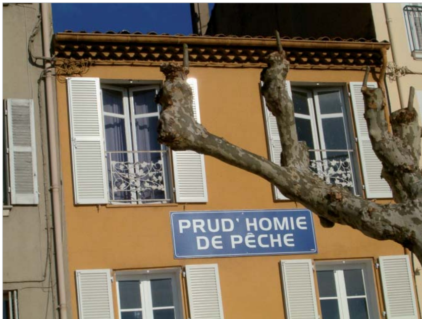
Les Prud'homies constituent une forme d'administration des pêches à la fois décentralisée, simple et démocratique