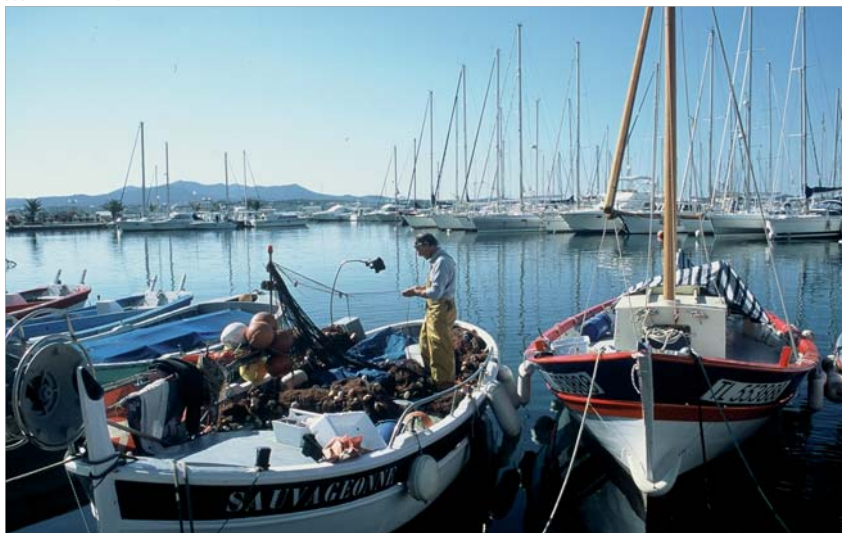
Petits bateaux à Sanary. La concurrence entre les métiers a entraîné une segmentation de la flotte française