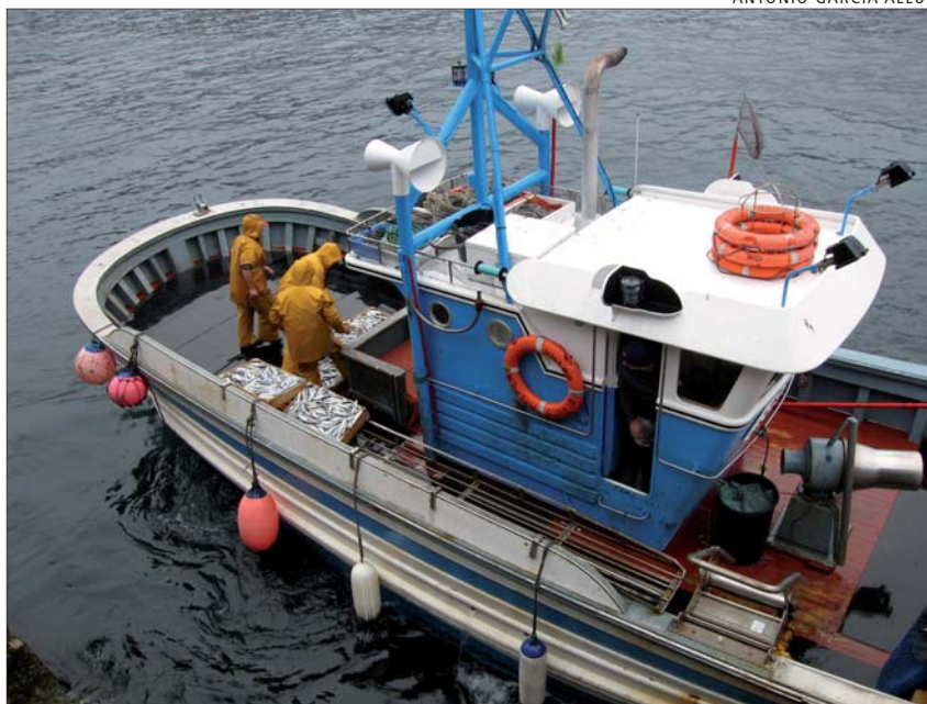
Pêcheurs préparant l'appât sur un palangrier à Cedeira, Galice, Espagne. La gestion de la pêche artisanale en Galice incombe parfois aux organisations de pêcheurs