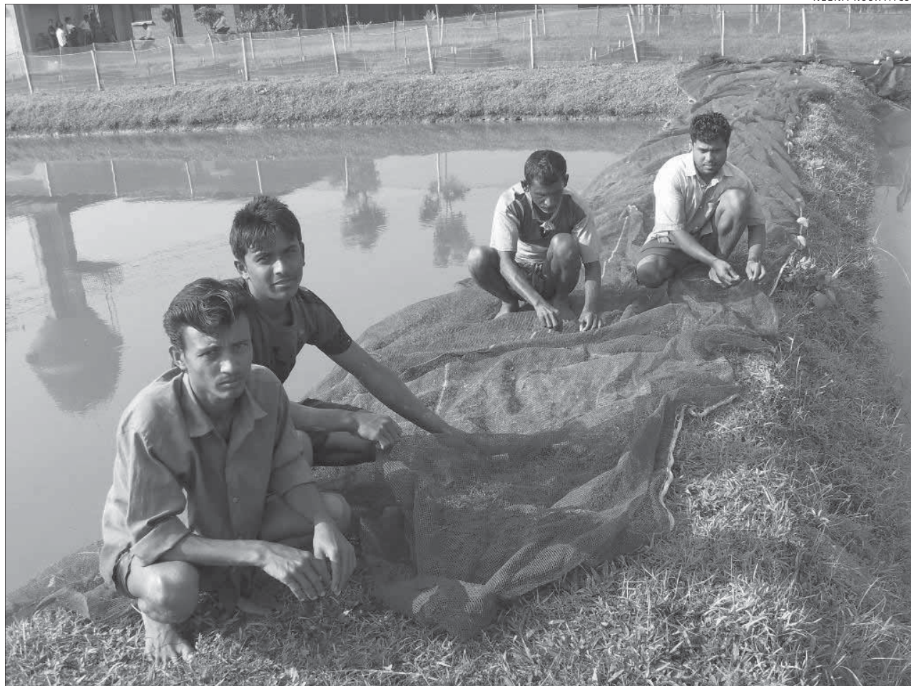
Travailleurs sur un bassin à l'Université agricole du Bangladesh, où l'on expérimente la polyculture avec ajout de petites espèces indigènes